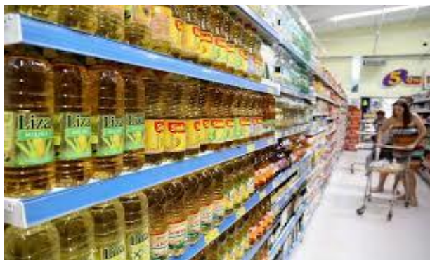
Governo do estado do Paraná

As análises realizadas pelos profissionais contábeis devem ser feitas de maneira cautelosa, uma vez que qualquer erro poderá ser o resultado na morte de empresas inseridas no mercado, a curto ou longo prazo.