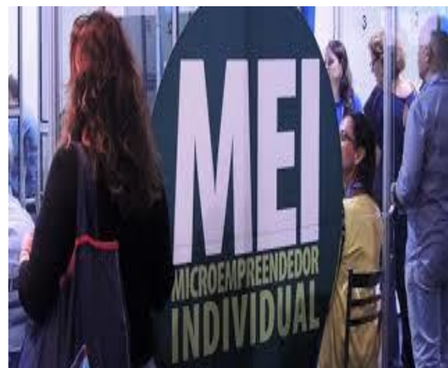
MEI receberá o auxílio emergencial.

É importante lembrarmos que o crédito fornecido para eles é relevante para que possam manter o capital de giro dos seus negócios, não permitindo a estagnação do negócio.