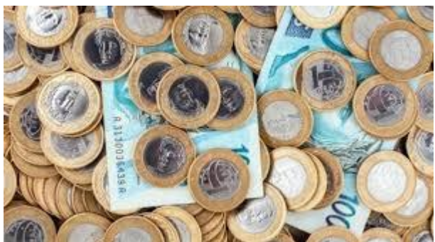
Colapso econômico em tempo de pandemia