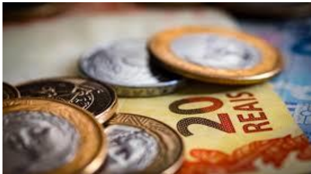
A recomendação do valor necessário para os próximos meses

Vale ressaltar também o apoio do presidente da caixa, Pedro Guimarães, que disponibilizará R$75 bilhões para auxiliar no combate à crise econômica do coronavírus.