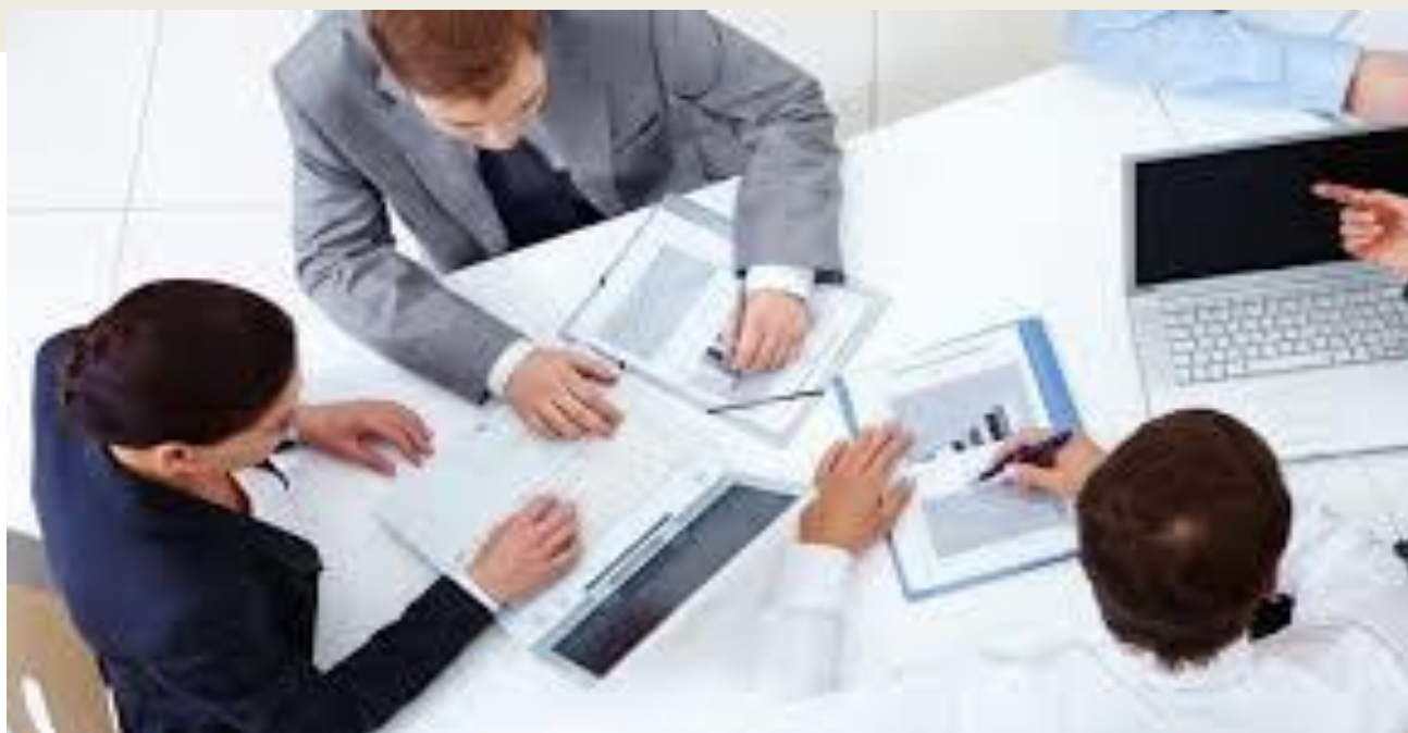
Importância da gestão contábil para as micro e pequenas empresas